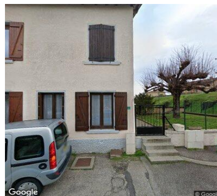
Vue STREET VIEW du secteur